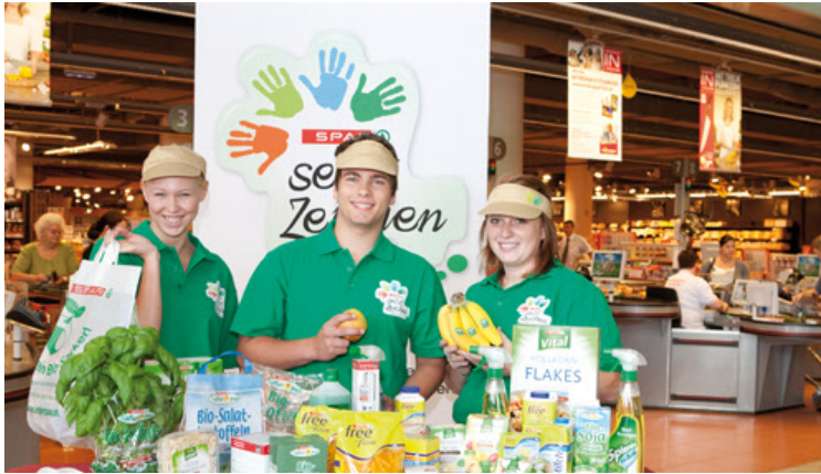
Lehrlinge informieren über SPAR als nachhaltig agierendes Unternehmen.

Nachhaltige Produkte haben längst ihren Platz im SPAR-Sortiment. Zusätzlich reagiert SPAR Österreich jetzt als erstes mitteleuropäisches Handelsunternehmen auch in der Ausbildung auf diesen Trend: Nachhaltigkeit wird fix in die Mitarbeiterausbildung integriert. Rund 2.500 Lehrlinge haben sich in den vergangenen Monaten Fachwissen