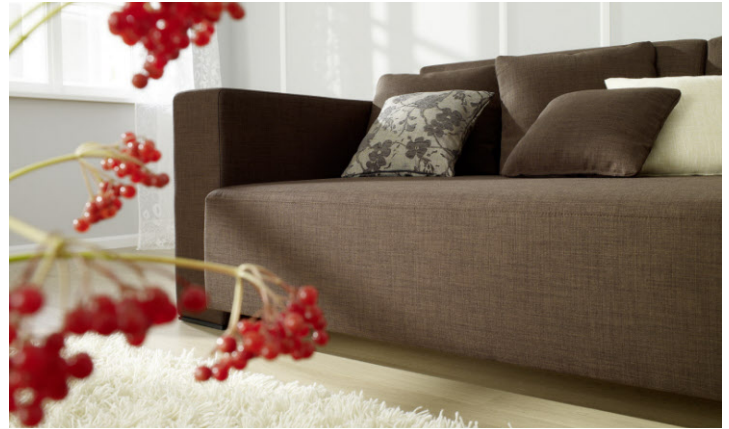
Bettsofa von Joka, gesehen bei Möbel Treml